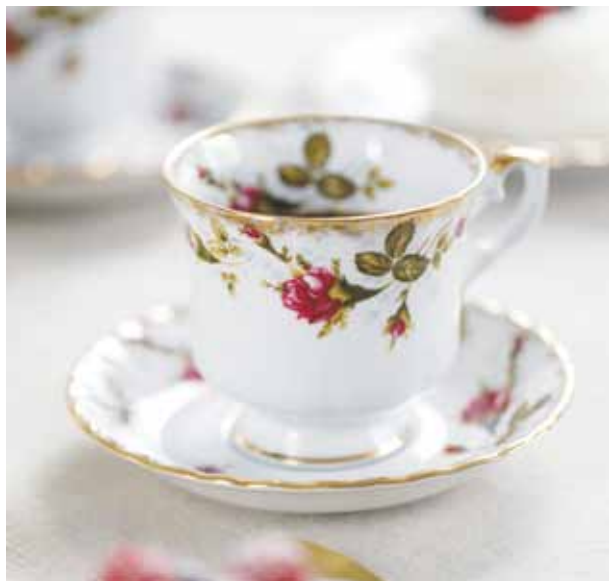
Kolekcja Iwona Złota Róża; marka Chodzież

Sercem marki są klasyczne kolekcje, które od pokoleń są obecne w codziennym życiu polskich rodzin. Wśród nich niezmiennie króluje kolekcja Iwona Złota Róża. Motyw angielskich róż zdobiący porcelanę stał się jej znakiem rozpoznawczym, a sama kolekcja od ponad 40 lat zachwyca subtelnością formy i ponadczasowym urokiem.